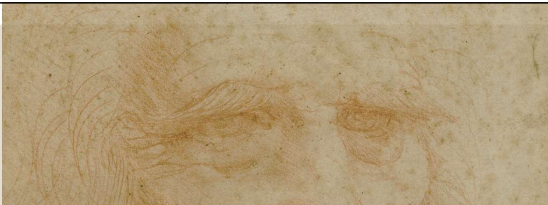
Leonardo da Vinci, Autoritratto , Torino, Musei Reali – Biblioteca Reale Pietra rossa su carta, 1517 circa

I Musei Reali di Torino promuovono una mostra dedicata all' Autoritratto di Leonardo da Vinci , uno dei capolavori assoluti della storia dell'arte di tutti i tempi