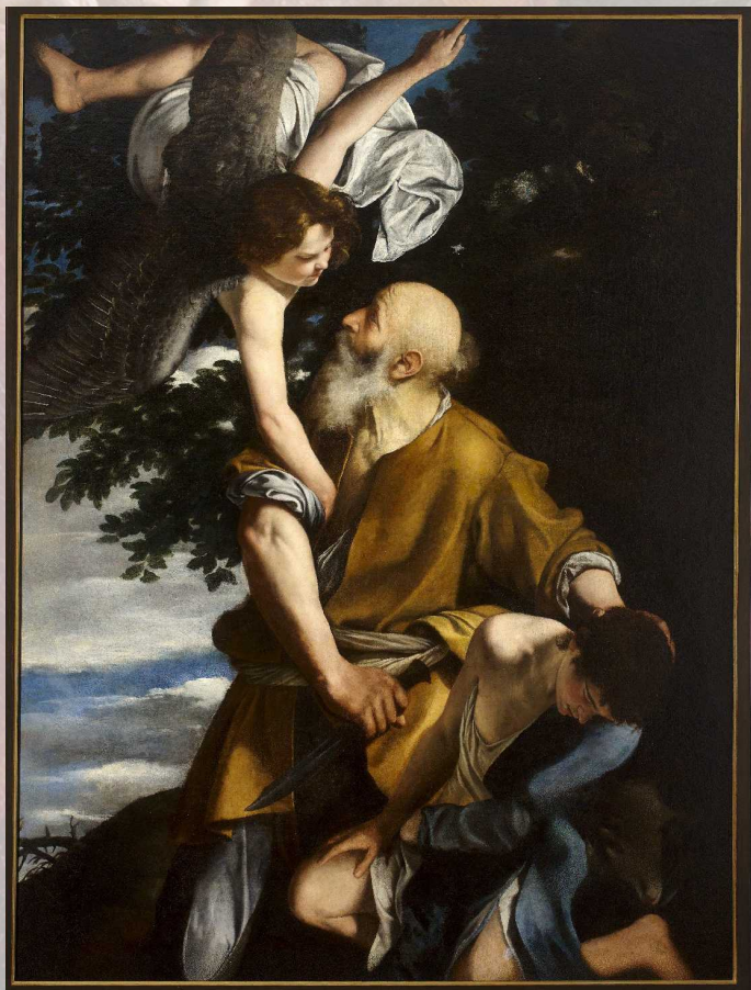
Sacrificio di Isacco , Genova, Galleria Nazionale di Palazzo Spinola

mettendolo in dialogo con i contesti figurativi e con gli artisti di volta in volta incontrati, con le figure dei committenti e con le esigenze del mercato.