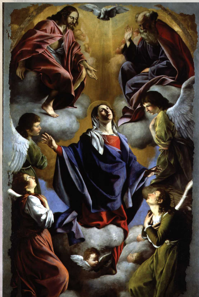
Madonna in Gloria e Santa Trinità Torino, Museo Civico d'Arte Antica - Palazzo Madama

Battezzato a Pisa il 9 luglio 1563, Orazio Gentileschi viaggia e soggiorna a Roma, Fabriano, Genova, Parigi e Londra, dove muore nel 1639, creando contestualmente relazioni con altre città italiane ed europee. Il suo percorso artistico è segnato da una continua metamorfosi stilistica e un particolare talento nel saper rispondere ai diversi stimoli, che lo porta, da artista di tarda maniera, ad aggiornare la sua pittura in direzione caravaggesca, a riflettere sui grandi interpreti del secolo d'oro fiammingo, fino a dare una decisa svolta in chiave di eleganza ed esuberanza cromatica, interpretando ogni linguaggio in chiave personale e mantenendo sempre una propria cifra