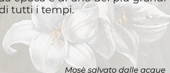
Mosè salvato dalle acque Madrid, Museo del Prado

Luce, grazia, colore caratterizzano il percorso artistico di Orazio Gentileschi, la cui straordinaria pittorica è stata ultimamente troppo messa in ombra dall'attenzione dedicata alla figura della figlia Artemisia; la mostra intende pertanto ripresentare al pubblico con un taglio inedito la stupefacente produzione di una vera e propria star della sua epoca e di uno dei più grandi pittori di tutti i tempi.